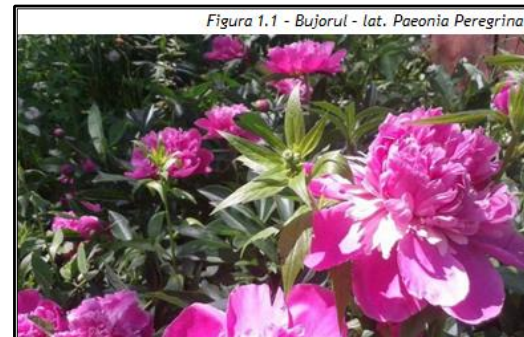
Figura 1.1 - Bujorul - lat. Paeonia Peregrina

Boli și dăunători - Este sensibil la atacul unor boli și dăunători. Este afectat de Putregaiul cenușiu care se manifestă prin pătarea florilor.