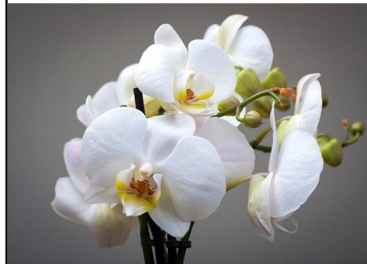
Figura 1.9 - Orhideea - lat. Orchidaceae

Lumina - Este un factor cheie în creșterea orhideelor, locul ideal este la o fereastră cu filtru (perdea). Culoarea frunzelor este un bun indicator al cantității de apă pe care o primește planta.