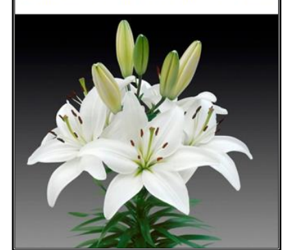
Figura 1.3 - Crinul de grădină - lat. Lilium

Lucrări de întreținere: Îndepărtarea florilor ofilite pentru a nu împiedica dezvoltarea celor sănătoase, tăierea tulpinelor și a frunzelor nu se va face imediat după ofilirea florilor ci după 2 - 3 săptămâni deoarece acestea conțin substanțe nutritive ce ajută bulbii să se dezvolte în anul următor.