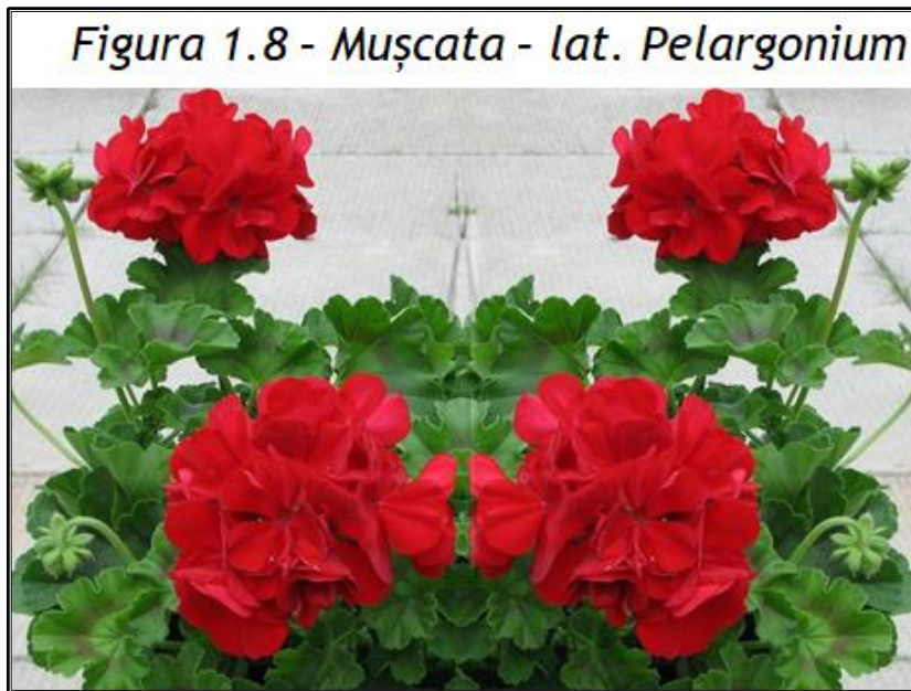
Figura 1.8 - Mușcata - lat. Pelargonium

Lumina și temperatura - Au nevoie de lumină naturală însă nu trebuie așezate direct în razele soarelui. Pe timpul verii se udă zilnic. Pe perioada iernii se depozitează în pivnițe unde temperatura să nu fie mai mică de 5 grade. Nu au nevoie de îngrijire specială.