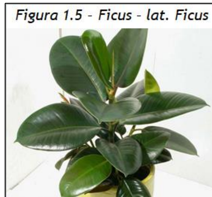
Figura 1.5 - Ficus - lat. Ficus

Temperatura și lumina - Tolerează o gamă largă de condiții de temperatură de la 13 - 29 grade. Nu este dorit soare direct, cresc bine și la lumină artificială sau umbră parțială.