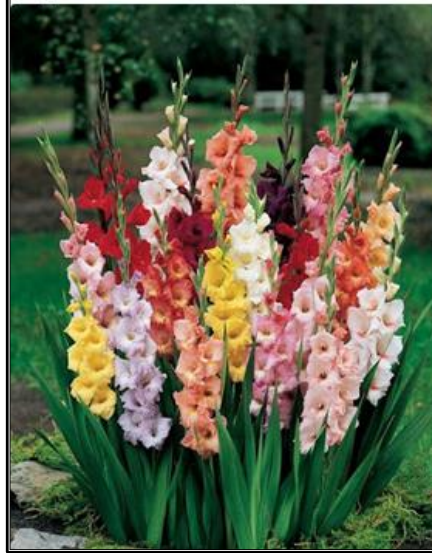
Figura 1.6 - Gladiola de grădină - lat. Gladiolus

Lucrări de întreținere: Distrugerea buruienilor și a crustei de la suprafața solului prin prășire, mușuroitul în jurul plantei când încep să se observe tijele florale și tutoratul cu țărugi de lemn cu înălțimea de peste 1 m datorită faptului că sunt plante înalte.