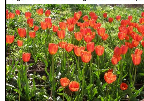
Figura 1.7 - Laleaua de grădină - lat. Tulipa

Lucrări de întreținere: Se recomandă afânarea sistematică a solului pentru preîntâmpinarea formării crustei de pământ și acoperirea terenului după efectuarea plantării cu un strat de circa 8 cm de turbă în stare umedă pentru a proteja bulbii împotriva înghețului.