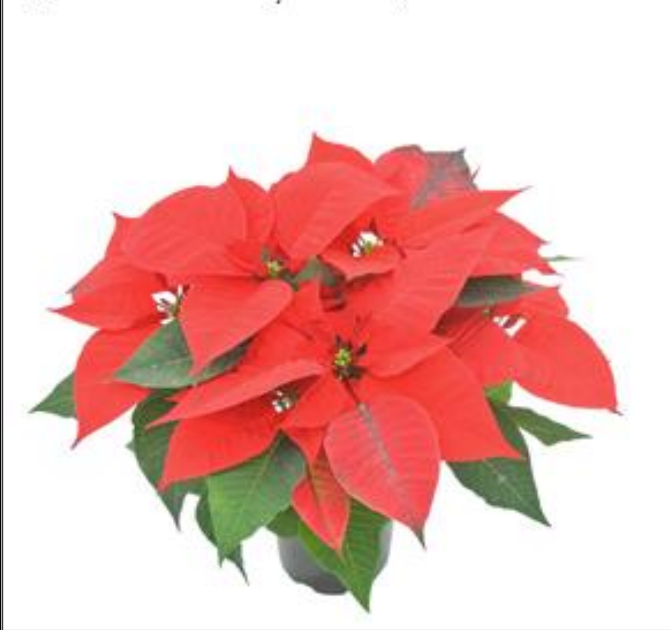
Figura 1.2 - Crăciunița - lat. Euphorbia Pulcherrima

Fertilizare - După înflorire în luna decembrie vei observa că partea de deasupra începe să se ofilească și să cadă. Acesta este momentul potrivit să o fertilizezi cu substanțe potrivite achiziționate de la magazine specializate (farmacii fitosanitare). Când planta înflorește din nou o poți fertiliza la fiecare 30 zile ca planta să se dezvolte sănătos.